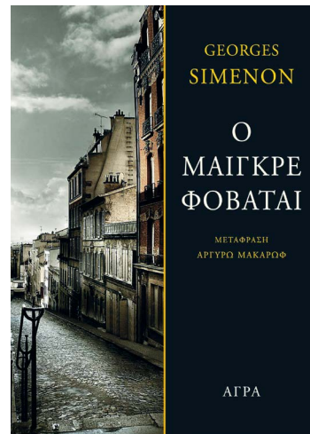
Image 4. Maigret a peur [ O Maigkré phobatai ], traduit par A. Makarof, éd. Agra (2015)

Notons aussi que nous sommes d'accord avec Tatsopoulou (2016) sur la connaissance approfondie du français et du belge, mais aussi de la Belgique, que possède Makarof. Ses traductions respectent en effet parfaitement le style et la culture du texte source, bien qu'une explicitation soit parfois nécessaire, comme pour le Bazar de l'Hôtel de Ville dans Maigret et son mort (1948) [ O Maigkré kai o nekros tou , 2018], qui serait plus intelligible pour le lecteur grec s'il était présenté comme le grand magasin en face de l'Hôtel de Ville, puisqu'il s'agit d'un commerce généraliste et qu'on ne doit pas le confondre avec un lieu où l'on vend toutes sortes de marchandises bon marché. Le travail consciencieux de cette traductrice, qui traite les textes de Simenon comme des textes littéraires à part entière, est bien mis en valeur par les éditions Agra, unanimement reconnues pour leur grande qualité. Ainsi, l'on peut observer que la retraduction et la réédition des romans de Simenon contribuent pleinement à sa consécration dans le champ littéraire grec.